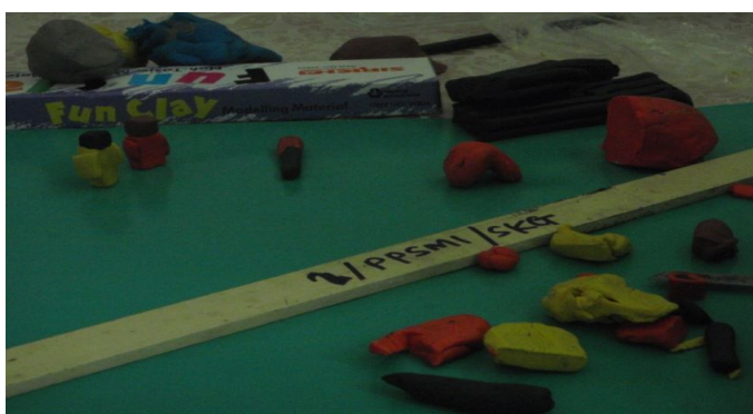
Gambar 1: Hasil semasa 'membentuk' tanah liat