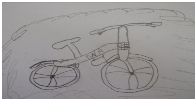
Gambar 1: Harapan Mat yang ingin memiliki basikal baru

Dalam sesi ketiga, saya meminta Mat melukis harapannya terhadap peristiwa kecurian basikalnya. Mat telah melukis sebuah basikal dan harapannya ialah untuk memiliki sebuah basikal baru. Tujuan saya meminta Mat melukiskan harapannya ialah untuk mengenal pasti apakah matlamat utamanya yang diinginkan oleh Mat selepas peristiwa yang berlaku pada dirinya.